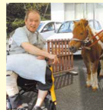
島田軽音倶楽部さん