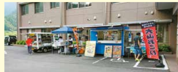
屋台...こちらは屋外スペースの屋台です お昼ときには長い行列ができており、大好評でした 暑い中、出展者の皆様には大変お世話になりました