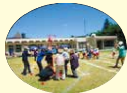
子供の国ミニ運動会

グループホームでは、季節に合わせた活動を行っています。4月から8月の様子を一部ですがご覧下さい。