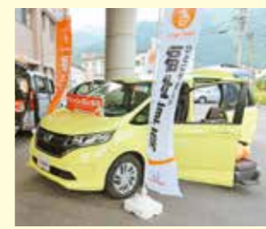
ホンダ...とても便利な福祉車両 後部座席がせり出してきて、座面も低くなるため、非常に乗り降りがしやすく、操作も簡単です