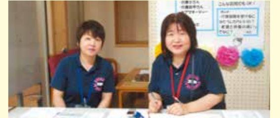
相談...介護保険や施設利用のあれこれをご説明させていただきました 「ご不明な点は私たちにおまかせ下さい!!」

この他、総勢約30組の団体様にご協力いただき、盛大に開催することができました これに限りませず、今後ともよろしくお祈り申し上げます