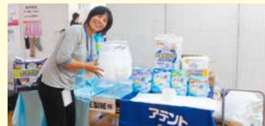
アネット...リハビリパンツや尿取パットの紹介です わかりやすく、立ち寄られた皆様が熱心に話を聞いていらっしゃいました