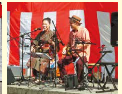
ないちゃーれきおーずさん